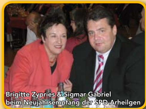
Brigitte Zypries & Sigmar Gabriel beim Neujahrsempfang der SPD Arheilgen