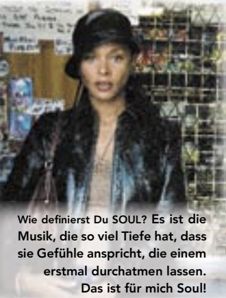
Wie definierst Du SOUL? Es ist die Musik, die so viel Tiefe hat, dass sie Gefühle anspricht, die einem erstmal durchatmen lassen. Das ist für mich Soul!