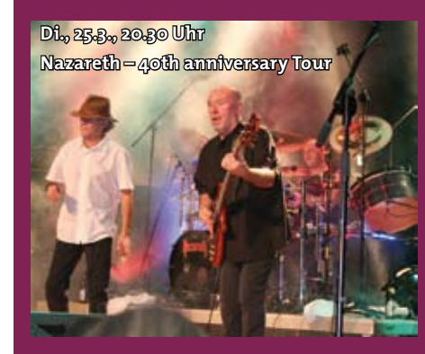
Di., 25.3., 20.30 Uhr Nazareth - 40th anniversary Tour

M.G.: ...eben. Aber es kommen auch viele der Originale mit ihrem ureigenen Programm, mit ihrer unbändigen Kraft und Aussage – ich denke da