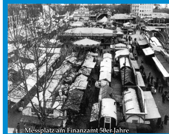
Messplatz am Finanzamt 50er Jahre

Doch von diesen Problemen merken die Besucher des Weihnachtsmarktes nichts. Sie genießen auch in diesem Jahr wieder den Glühweinduft und die vorweihnachtliche Atmosphäre im Herzen Darmstadts.